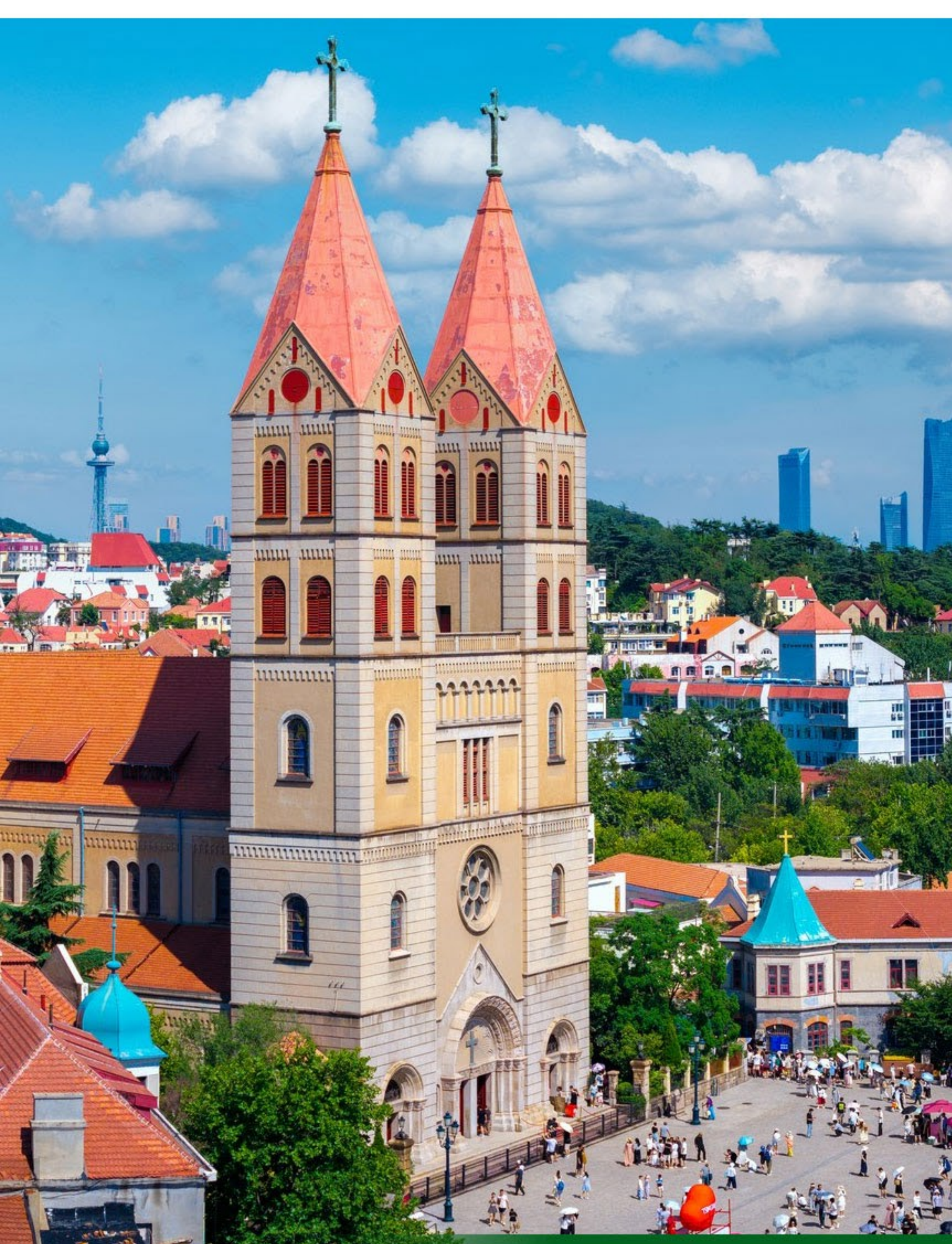
聖彌厄爾天主教堂