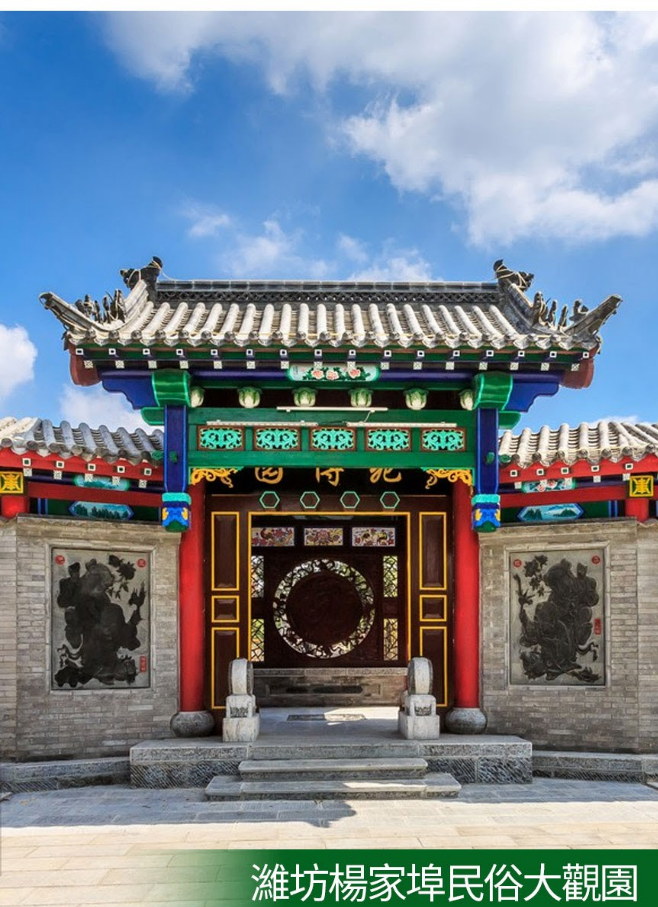
濰坊楊家埠民俗大觀園