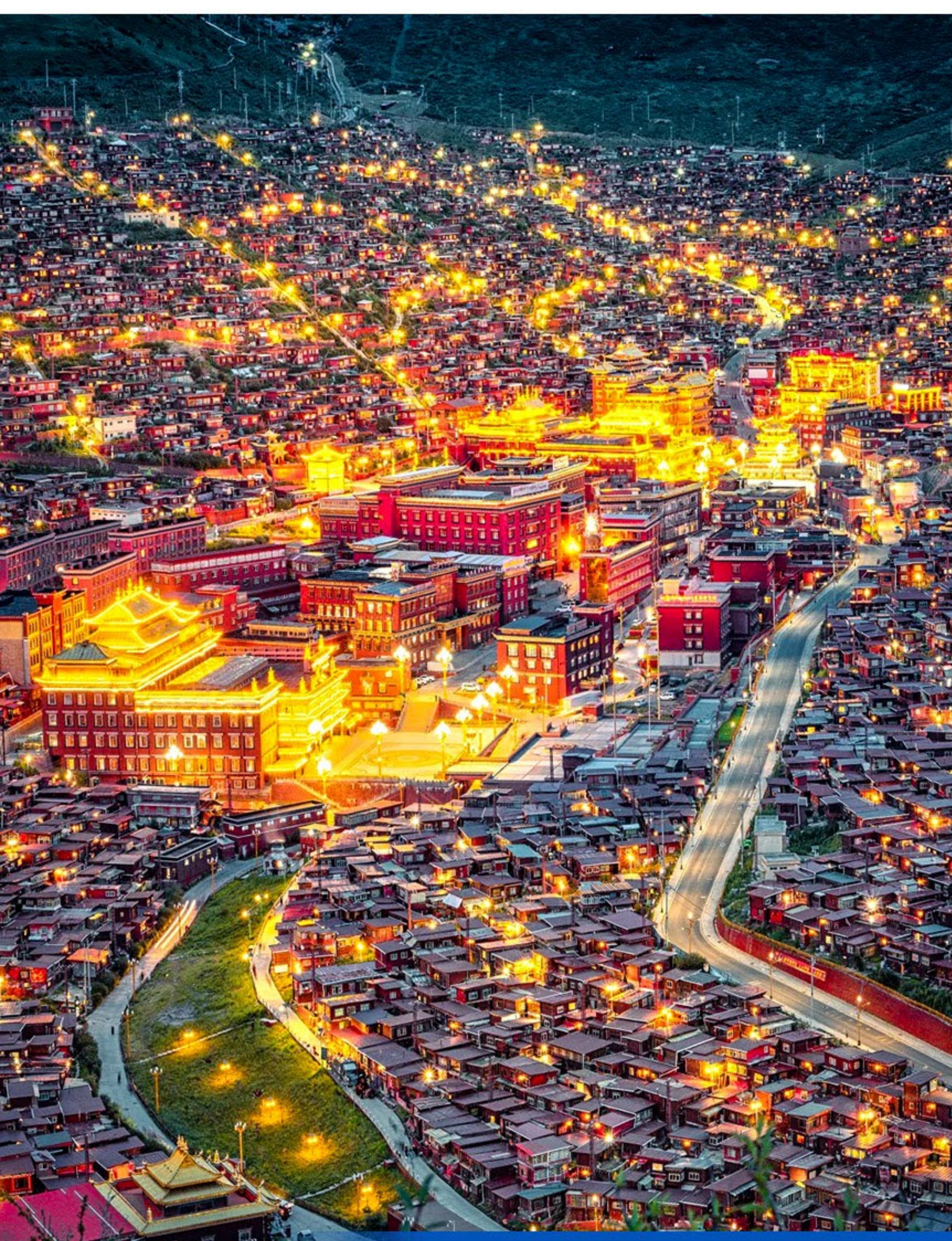
色達喇榮五明佛學院