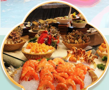
酒店海鮮自助晚餐