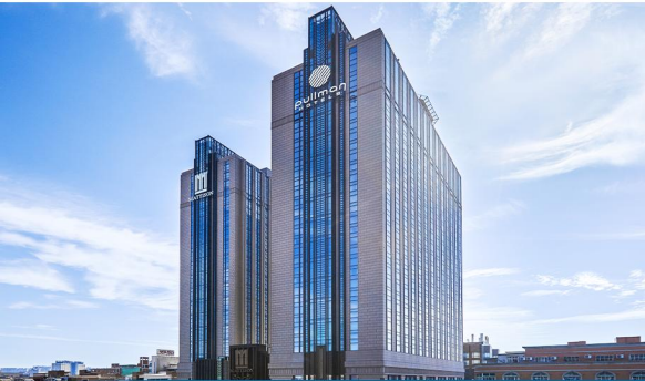
泉州石獅明昇雅高鉅爾曼酒店