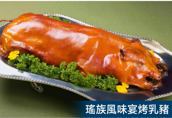
瑤族風味宴烤乳豬