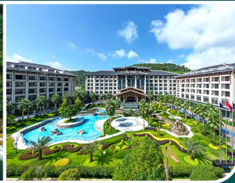
荔波古鎮 / 荔波大小七孔 / 黃果樹瀑布 / 青岩古鎮 / 烏江寨國際旅遊度假區