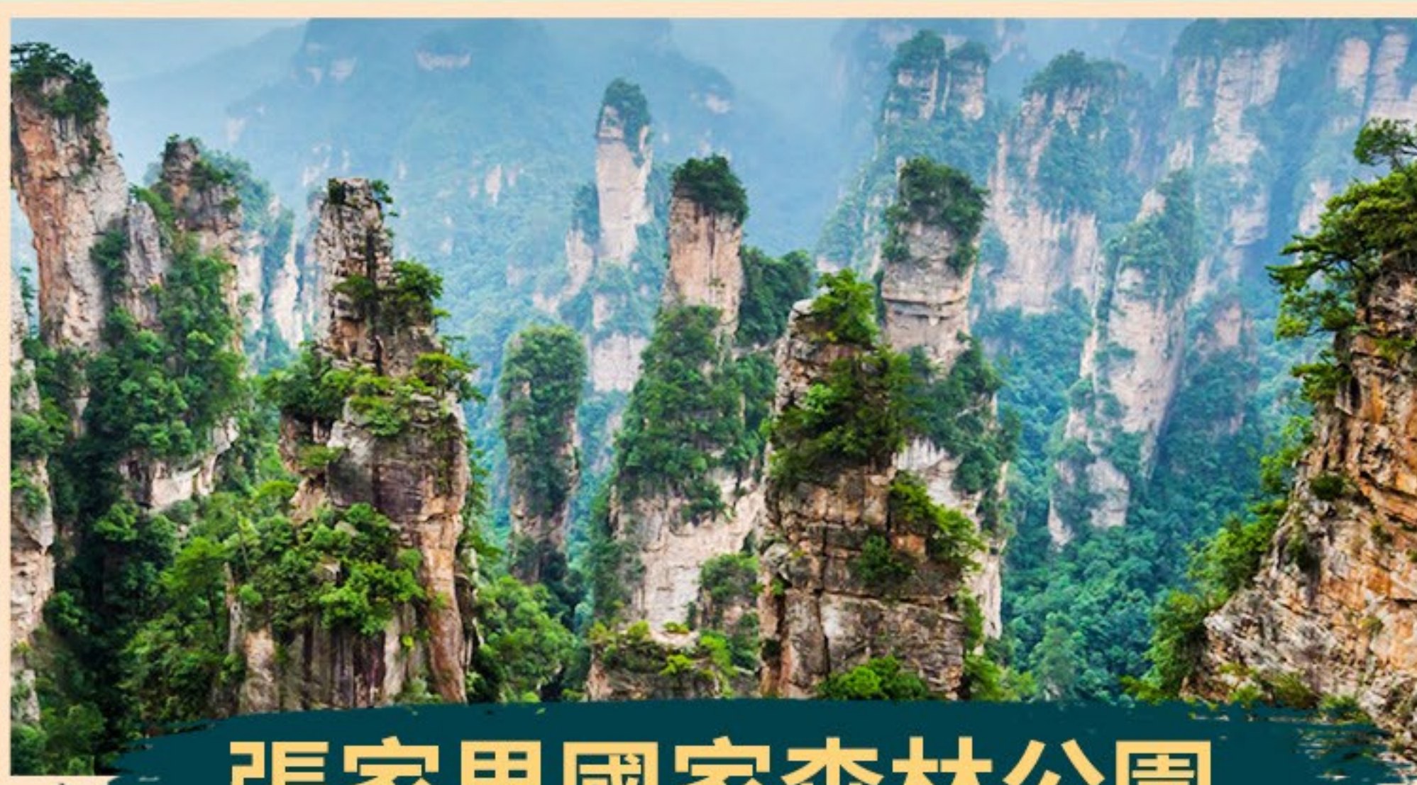
張家界國家森林公園