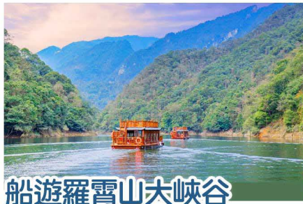
船遊羅霄山大峽谷

CRH 註：高鐵專列實際批核結果及發車時刻以鐵路局最終命令為準！（如無批准專列高鐵，則調整搭乘常規高鐵列車）