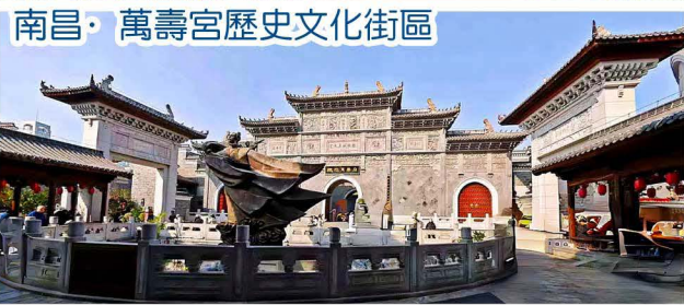
南昌·萬壽宮歷史文化街區