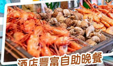
酒店豐富自助晚餐