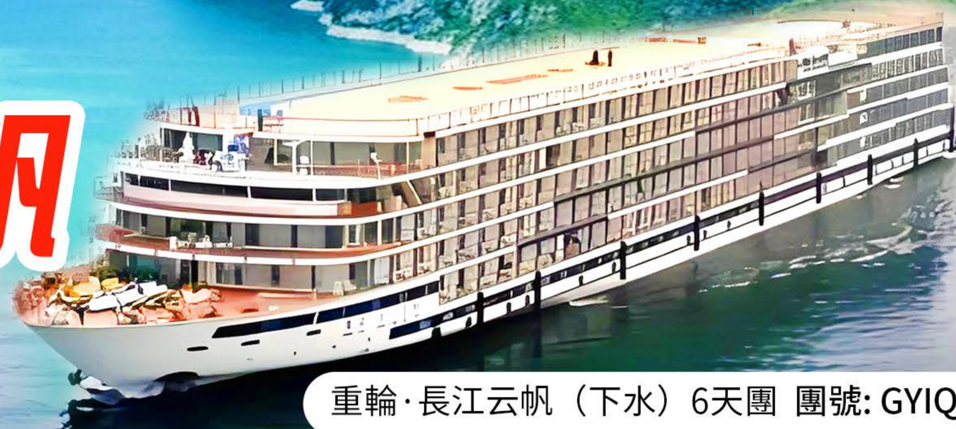
重輪·長江云帆（下水）6天團 團號: GYIQ602