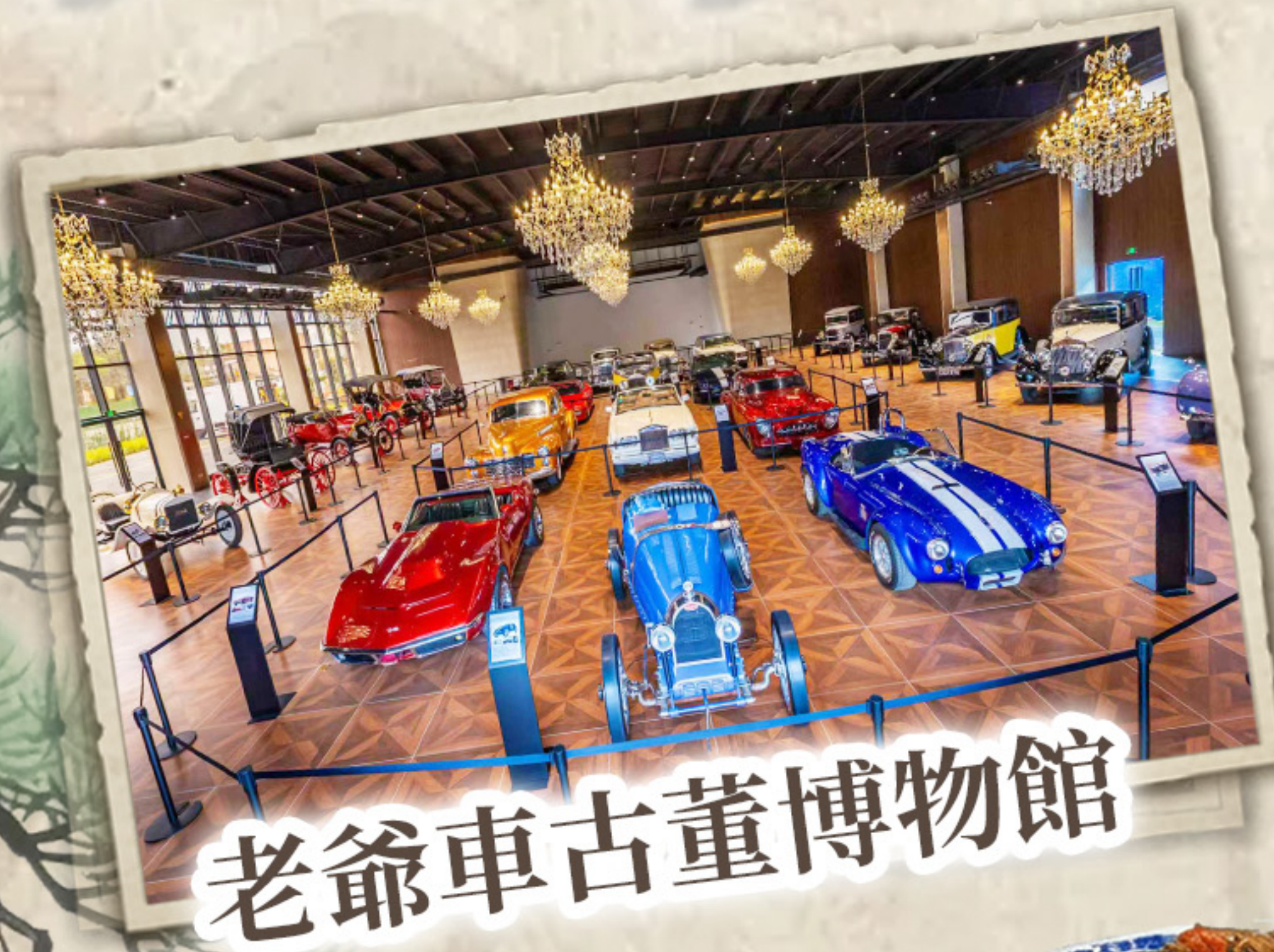
老爺車古董博物館