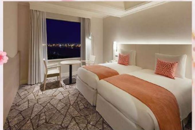
【東京 Grand Nikko Tokyo Daiba】位處台場區可欣賞醉人夜景