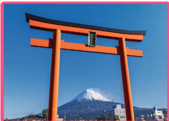
富士山本宮淺間大社