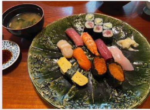
Omakase 廚師發辦時令壽司