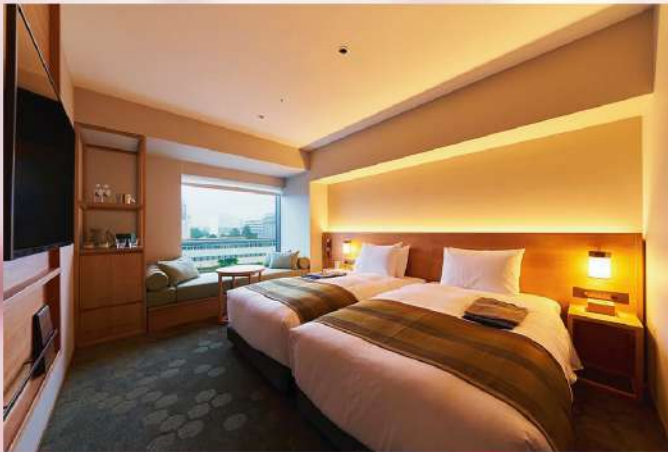
【三島市 Mishima Tokyu Hotel】酒店附設浴場洗卻旅程疲累