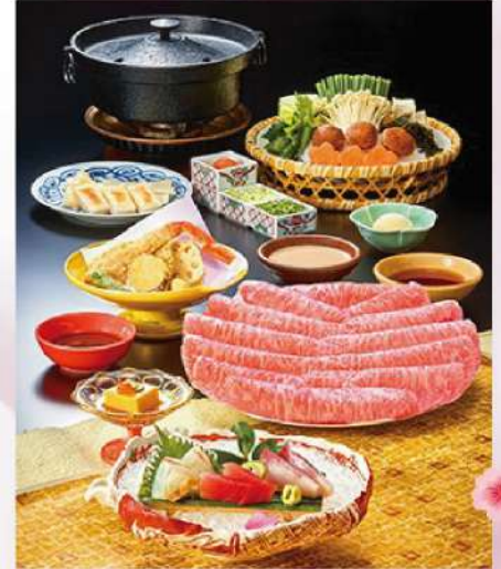
銀座區 霜降和牛Shabu Shabu