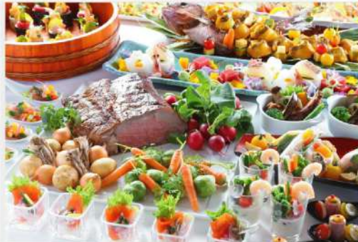
【四季彩】時令自助餐