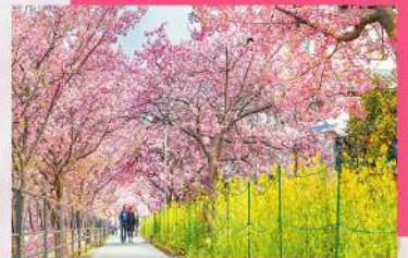
河津町河津櫻花祭