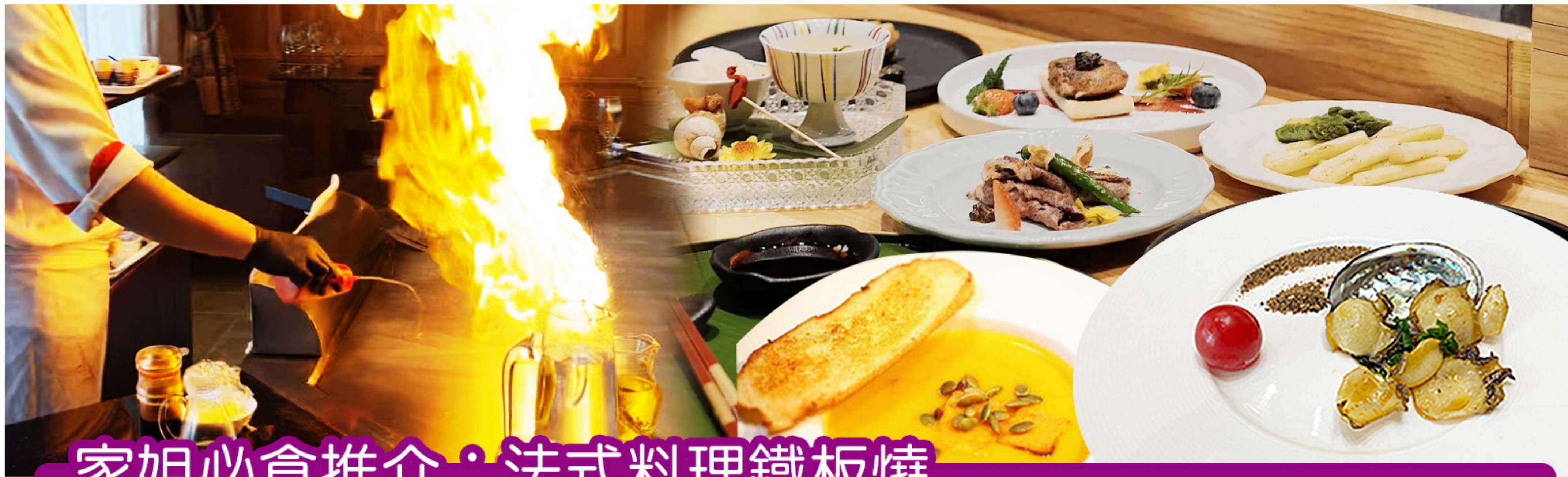
家姐必食推介：法式料理鐵板燒