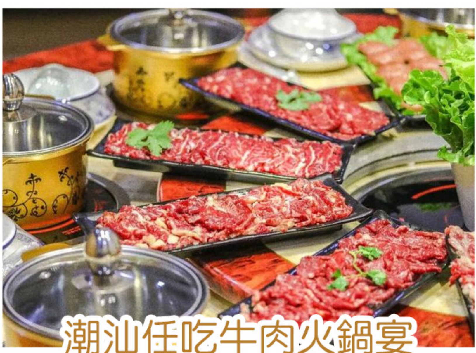
潮汕任吃牛肉火鍋宴 (一人一鍋)