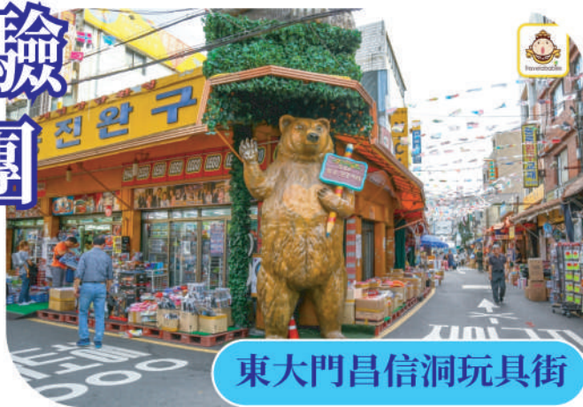
東大門昌信洞玩具街