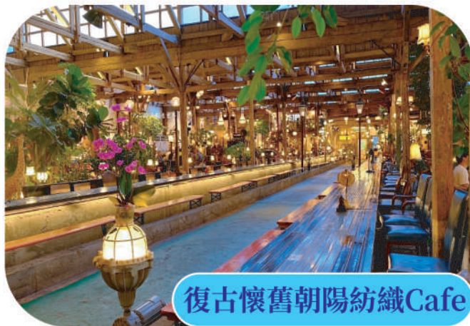
復古懷舊朝陽紡織Cafe