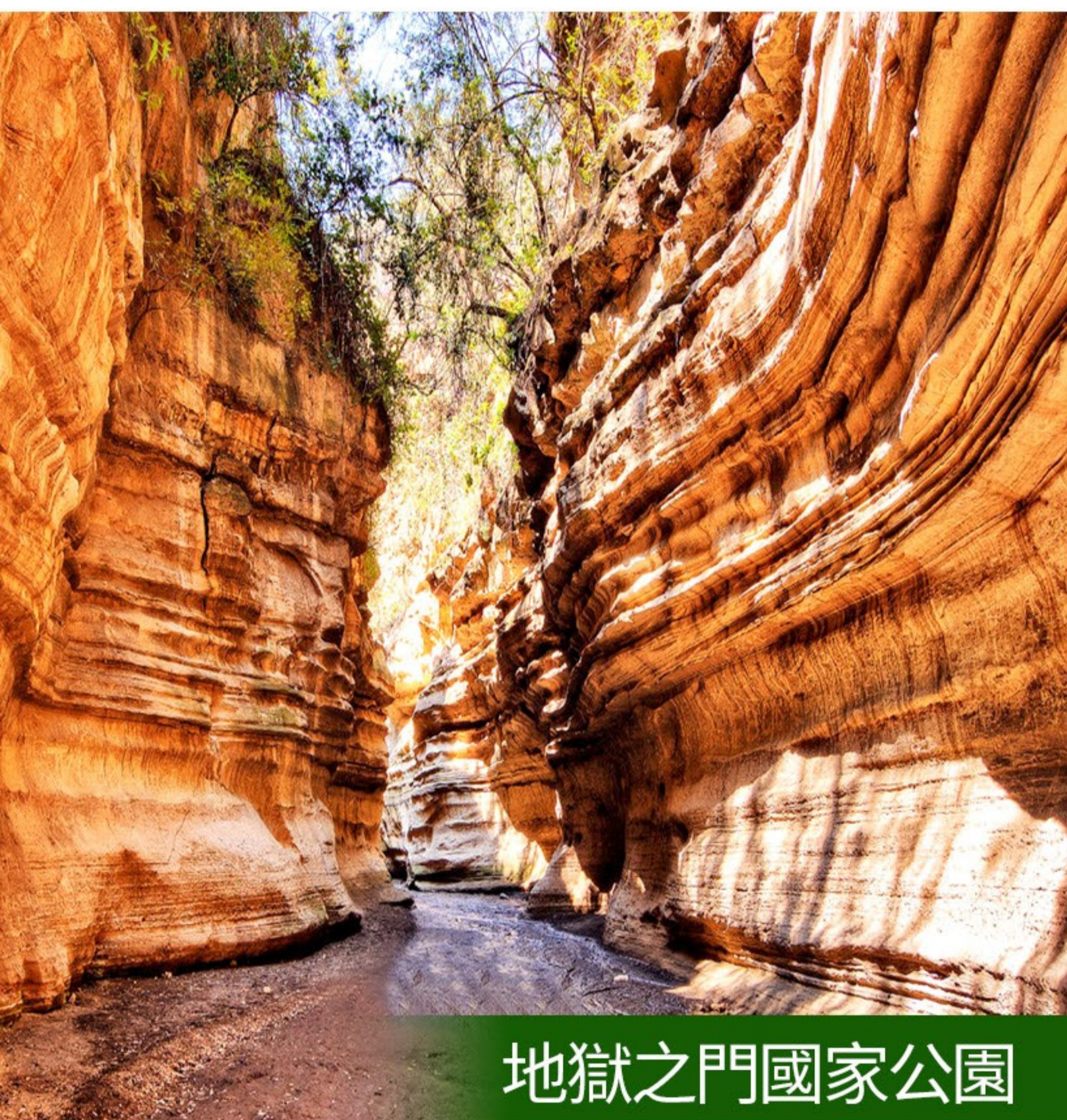
地獄之門國家公園