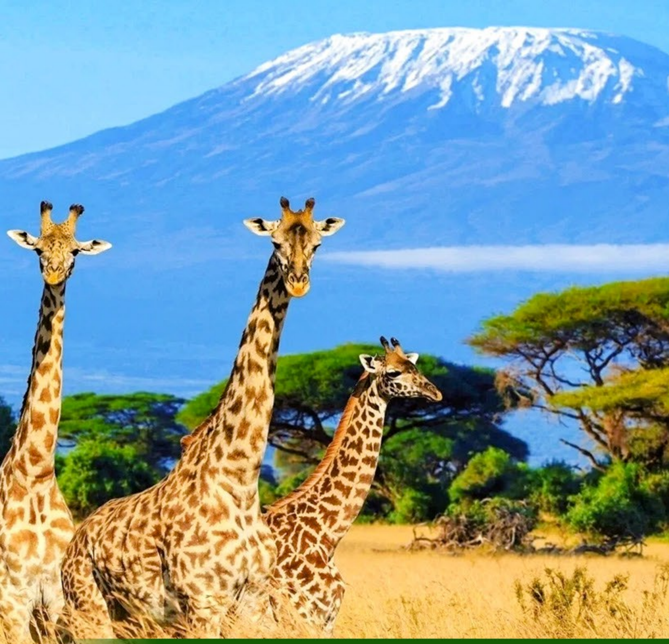
安布斯利國家公園SAFARI