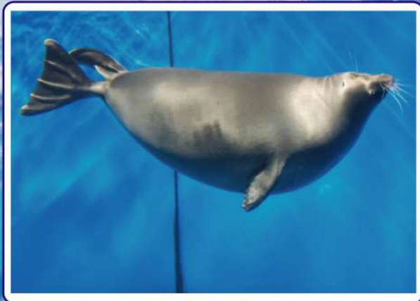
貝加爾生態博物館