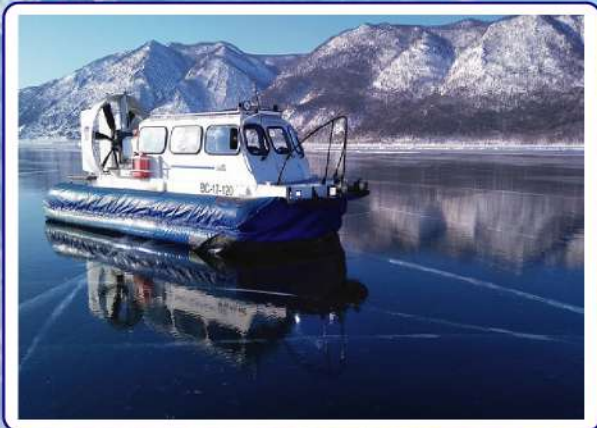
貝加爾湖氣墊船遊船