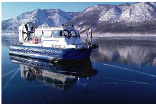
氣墊船遊貝加爾湖

李斯特維揚卡 | 氣墊船遊湖 | 雪橇犬養殖場 + 安排體驗冬季限定：狗拉雪橇 | 貝加爾在地居民村落切爾斯基登山觀景台(包纜車登山) | 貝加爾湖生態博物館(包入場) | 貝加爾湖魚市場及紀念品市場 |