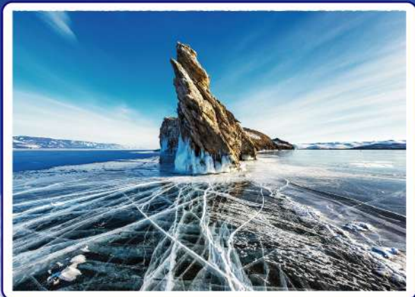
奧立洪島 · 鷹咀山