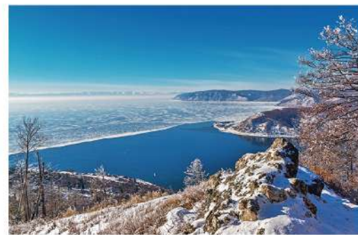
切爾斯基登山觀景台

搭乘纜車上到貝加爾湖畔切爾斯基山步行一段抵達山頂的觀景平台，在此眺望安加拉河的發源地，它是唯一一條從貝加爾湖流出的河流出口，在觀景台並可欣賞貝加爾湖湖岸峭壁及美麗的風光。