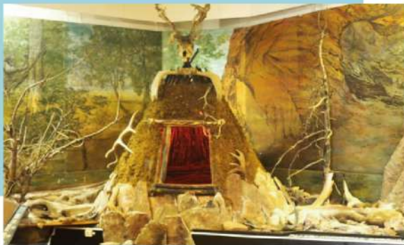
烏斯奇阿達爾地方誌博物館

註1:碼頭至奧立洪島交通工具會因冬天結冰厚度等因素來安排氣墊船或UAZ四輪驅動吉普車前往。