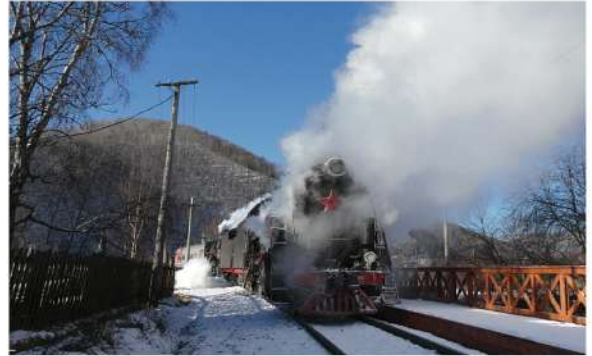
貝加爾湖環湖觀光火車

斯柳江卡小鎮的歷史始於1802年，1902-1916年的貝加爾湖環路鐵路段的建設，斯柳江卡車站以及斯柳江卡鎮得以建立。斯柳江卡車站是世界上唯一一座完全由白色大理石建造的火車站。2005年，對火車站建築進行了重建。