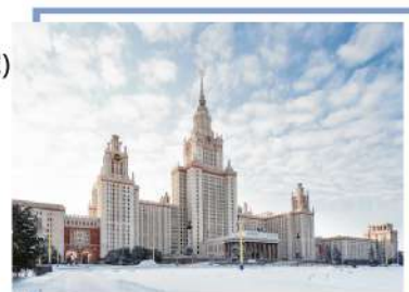
莫斯科大學 Moscow University

如因莫斯科往聖彼得堡/聖彼得堡往莫斯科高鐵列車爆滿，將改為乘坐內陸機取代高鐵，如內陸航班調動而影響當日之午如因內陸航班調動而影響當日之午/晚餐，本公司將退回受影響之團體餐費，客人不得異議