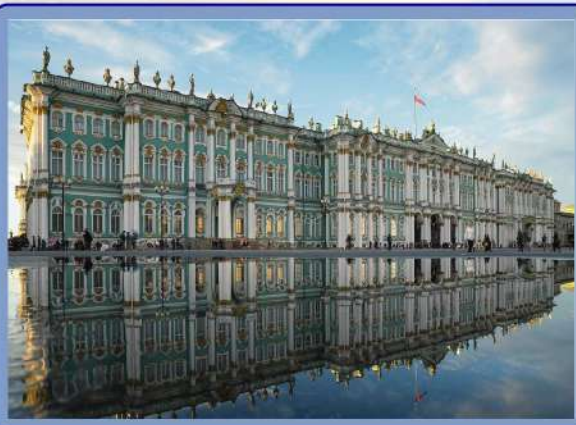
【冬宮】隱士盧博物館