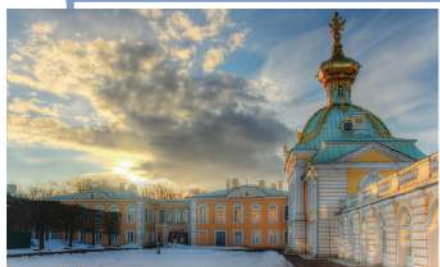
彼得夏宮 Peterhof Palace

聖彼得堡 | 彼得與保羅城堡(包入場) | 勝利柱 | 自費節目推介:尼華河船河暢遊 | 彼得大帝騎馬銅像(車遊) | 聖埃薩大教堂(外觀) | 尼古拉一世騎馬銅像 | 自費節目推介:俄羅斯國家縮影展覽館