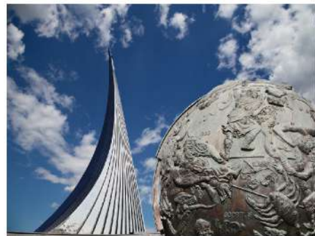
宇航博物館 Space Museum