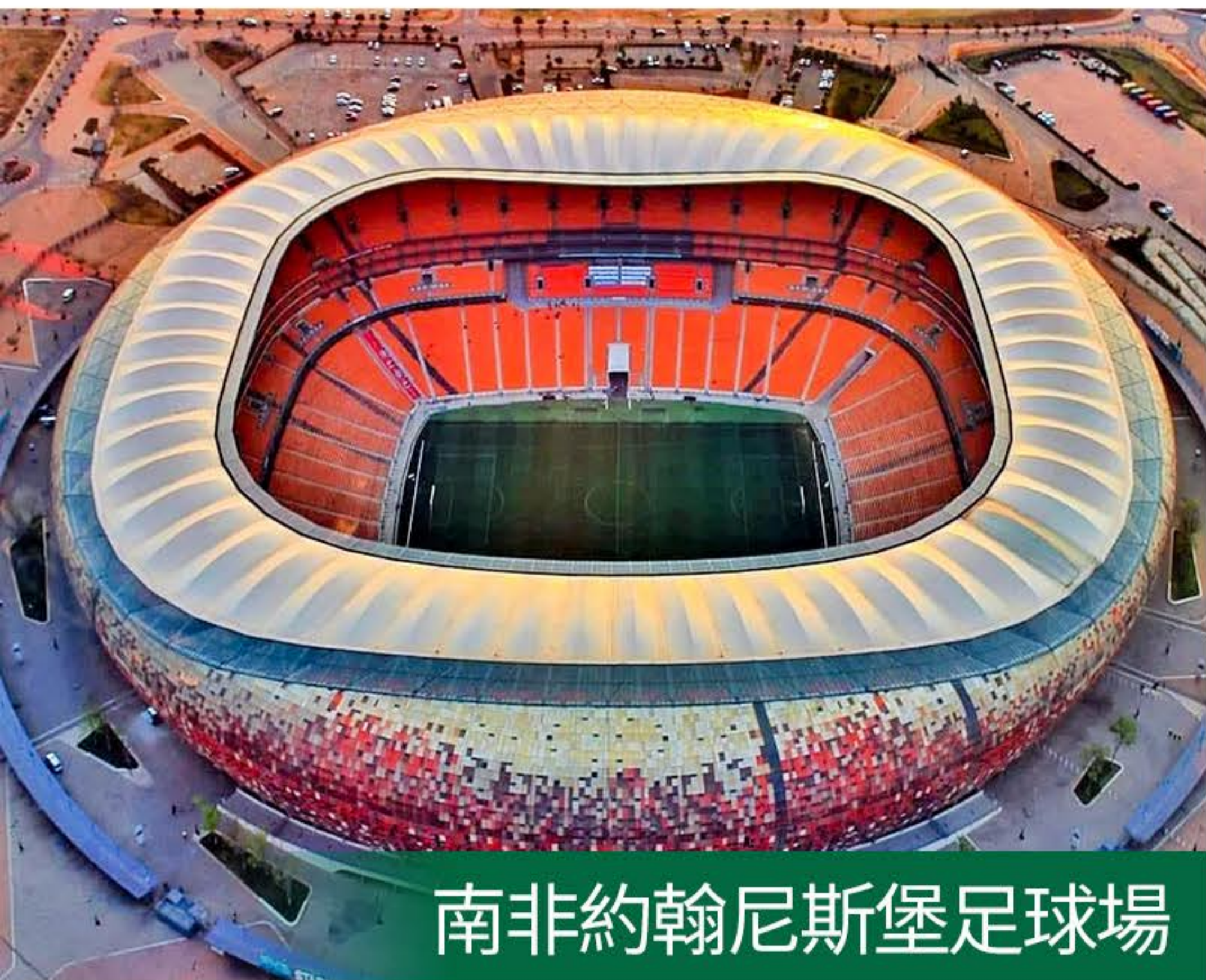
南非約翰尼斯堡足球場