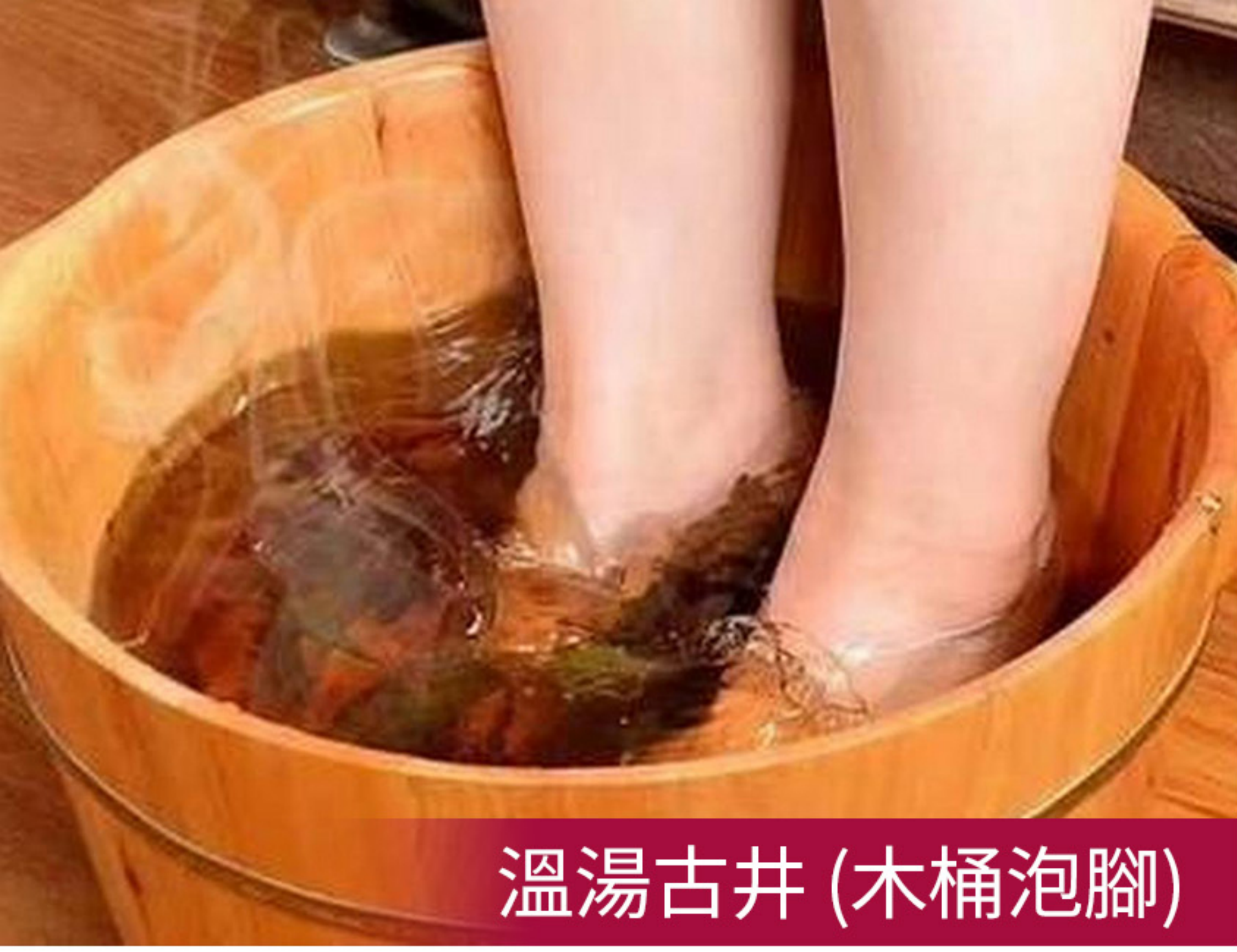
溫湯古井 (木桶泡腳)