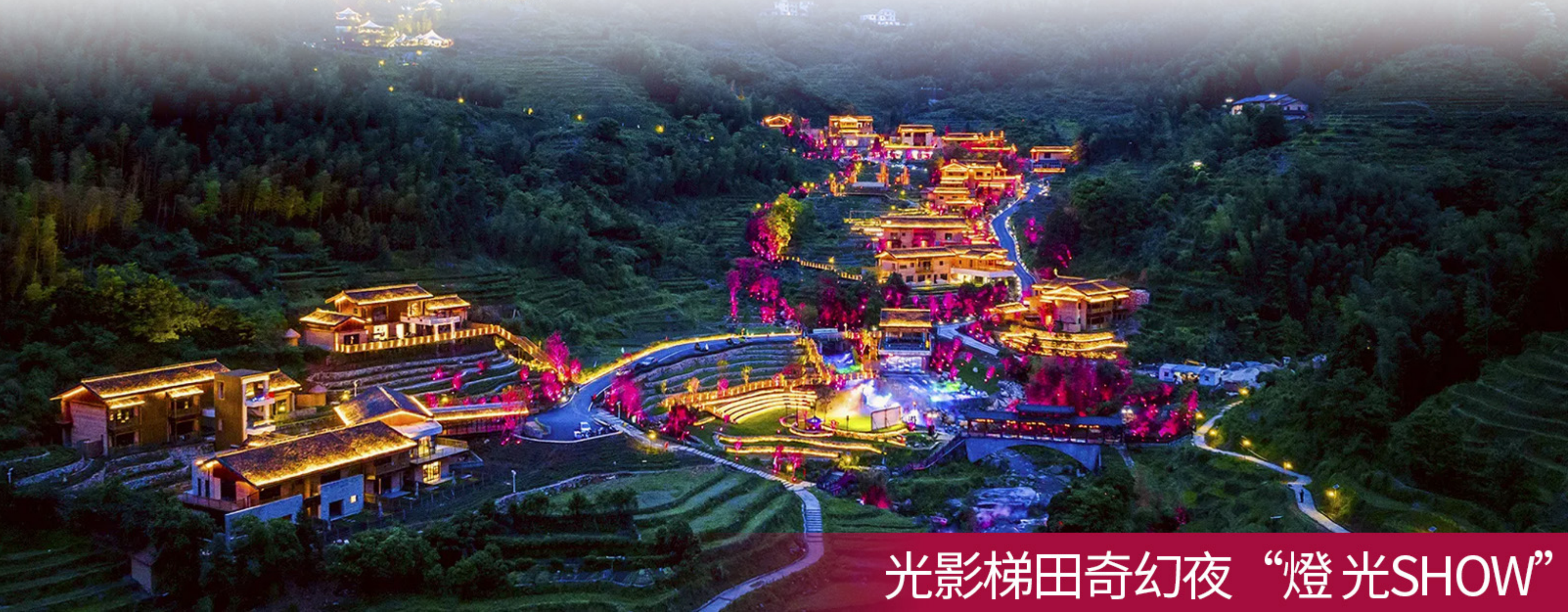
光影梯田奇幻夜“燈光SHOW”

酒店自助早餐→株洲 (BUS 約 2.5H)→網紅打卡炎帝廣場瞻仰巨型炎帝塑像→神農美食廣場→株洲西站-香港西九龍站(優先選用直達票,如無直達票則安排深圳北/廣州南轉乘)→西九龍站解散