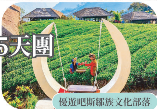
優遊吧斯鄒族文化部落