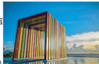
旗津半島-彩虹教堂

阿里山 | 祝山觀日*有機會觀賞日出, 雲海*(包乘坐小火車來回) | YuYupas優遊吧斯鄒族文化部落(欣賞鄒族歌舞) 南投 | 日月潭 | 自費節目推介: 日月潭遊船玄光島, 拉魯島 | 日月潭文武廟 | 台中 於優遊吧斯鄒族文化部落感受台灣山地文化, 再往南投日月潭飽覽山水之美, 不容錯失