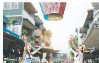
菁桐老街 · 放天燈

註1: 台北市立動物園當日展出之動物以園方公佈為準, 故不能以觀賞指定動物作參團理由, 敬請留意及諒解