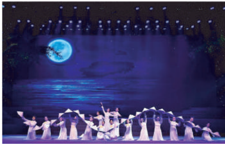
【峴港奧代秀或峴港魅力秀】