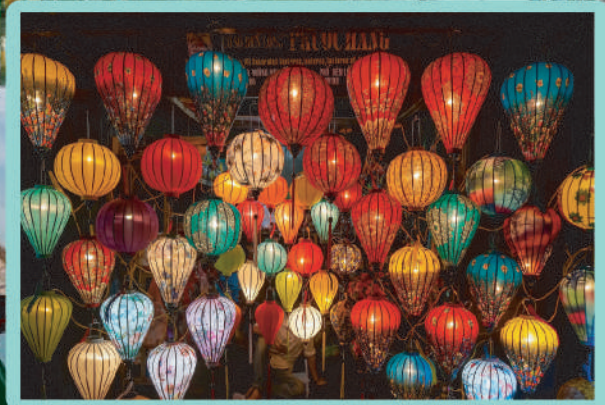
【世界文化遺產】會安古城