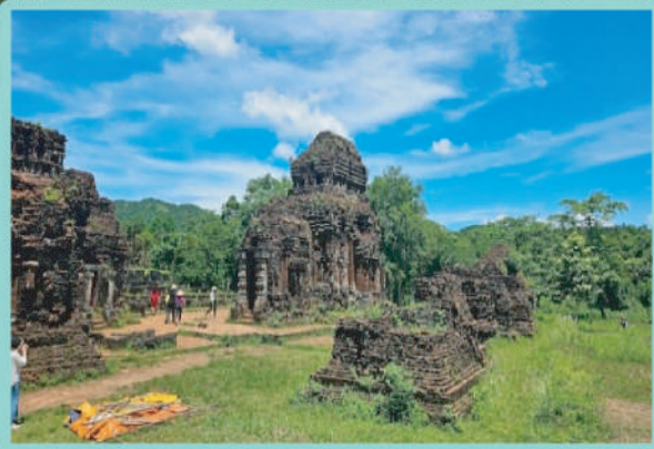
【世界文化遺產】美山聖地