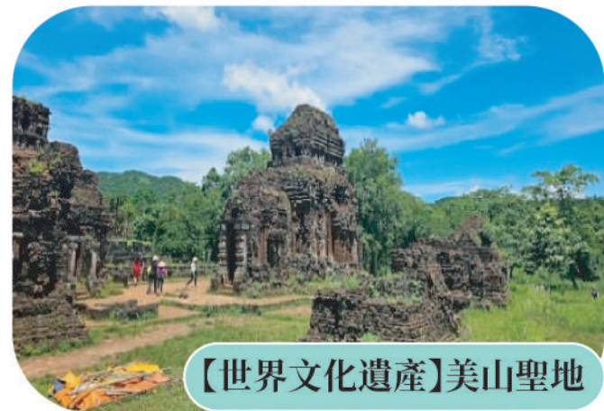
【世界文化遺產】美山聖地