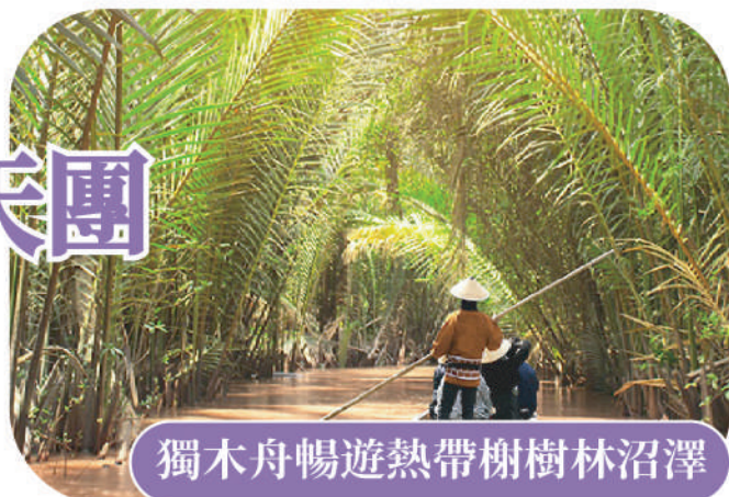
獨木舟暢遊熱帶樹樹林沼澤