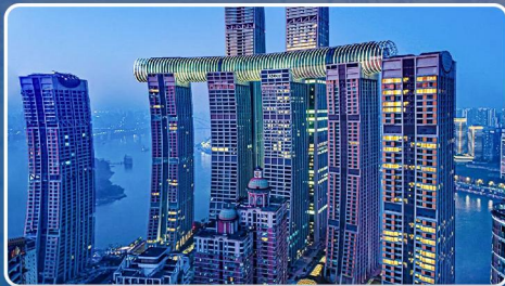
重慶網紅魔幻新地標·來福士廣場