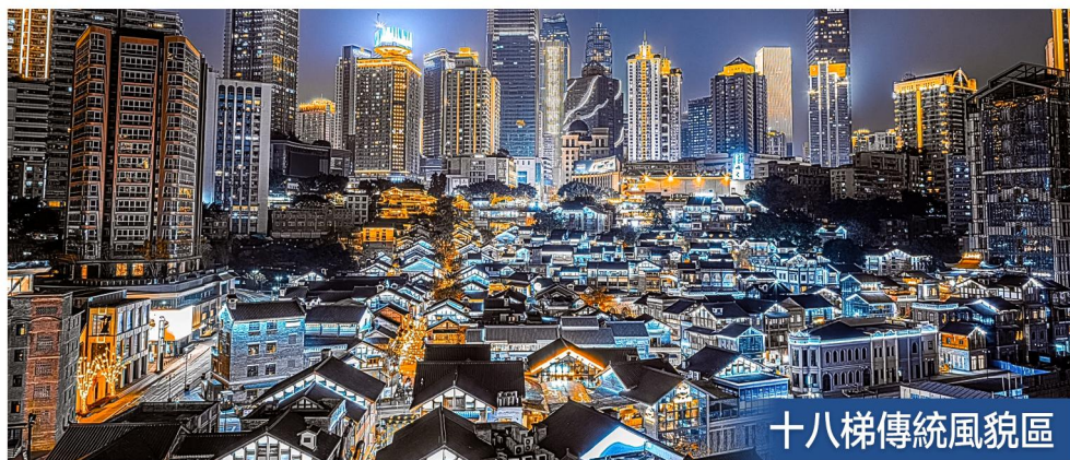
十八梯傳統風貌區