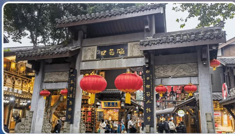
千年巴渝文化·磁器口古鎮