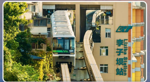
重慶必打卡·李子壩輕軌穿樓