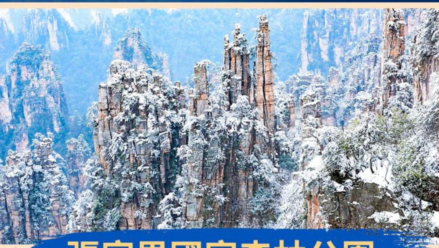
張家界國家森林公園