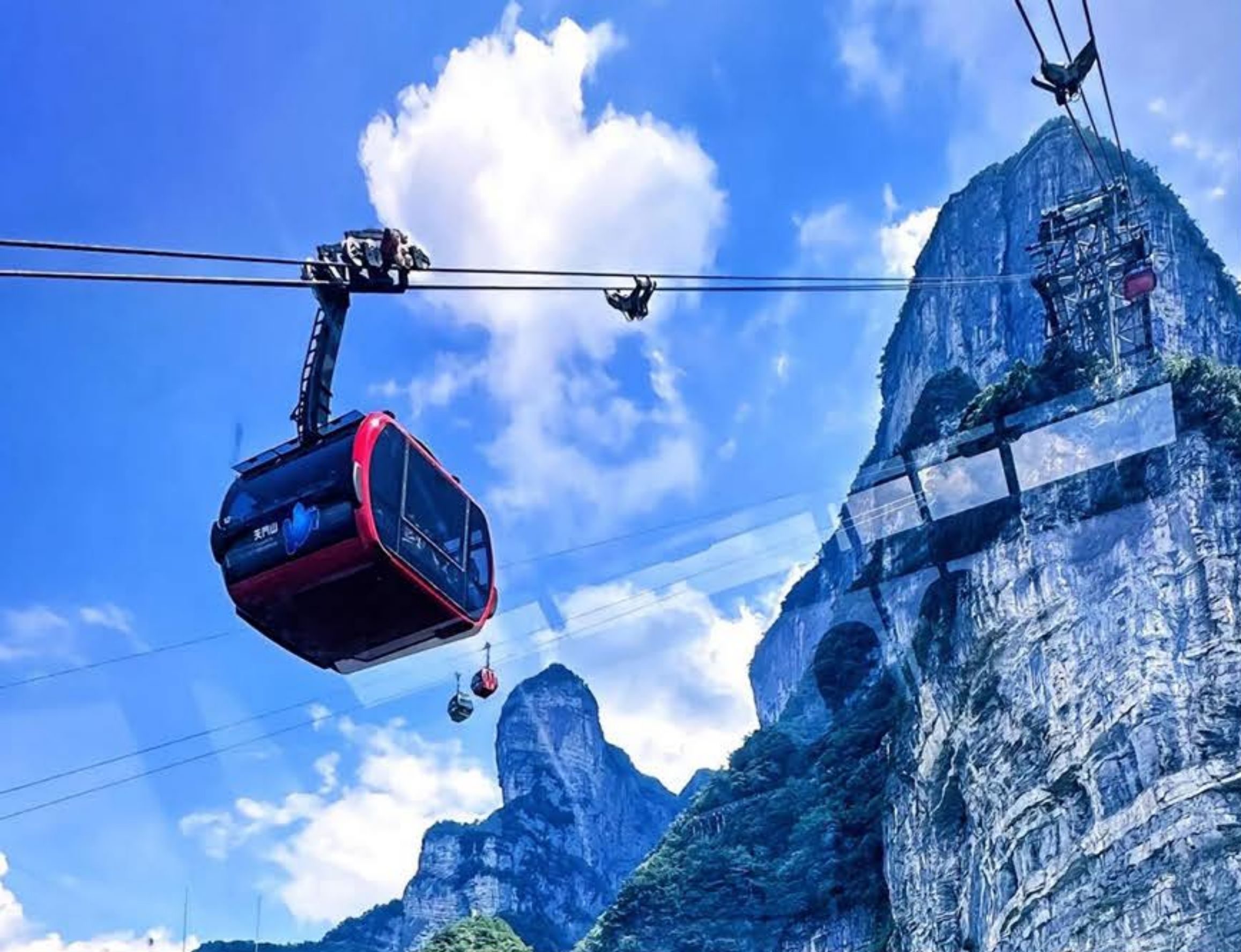
張家界天門山國家森林公園