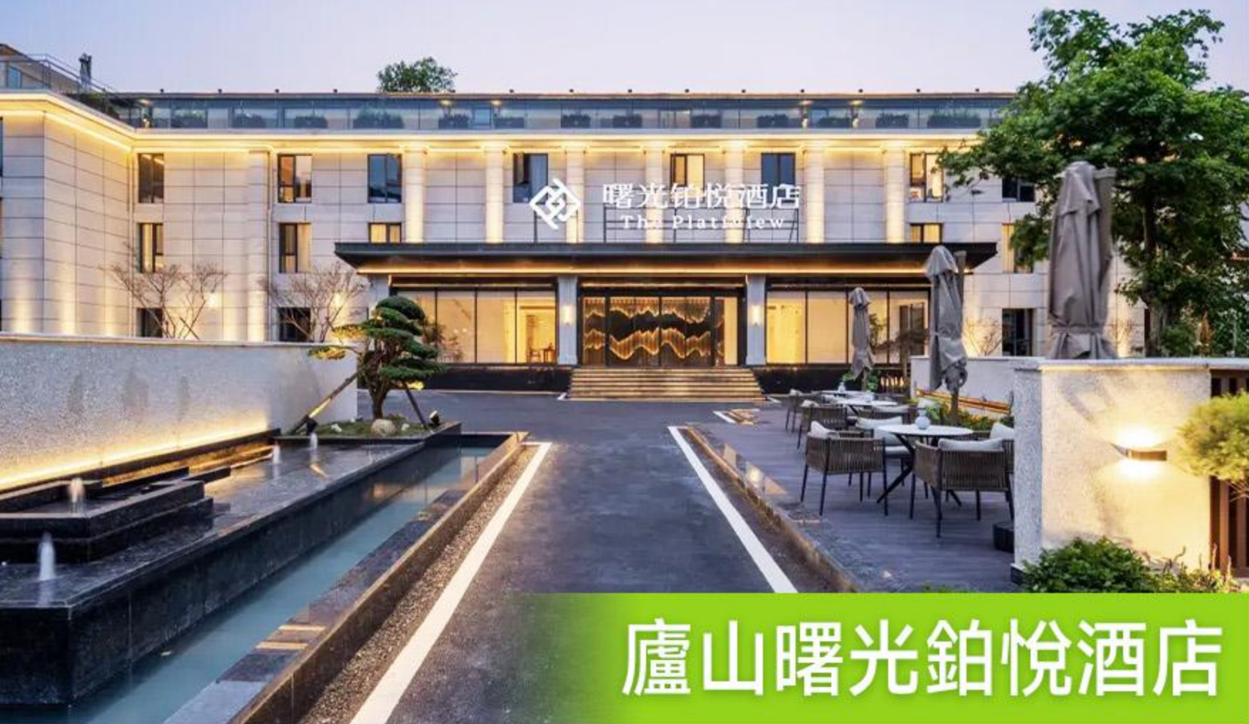
廬山曙光鉑悅酒店