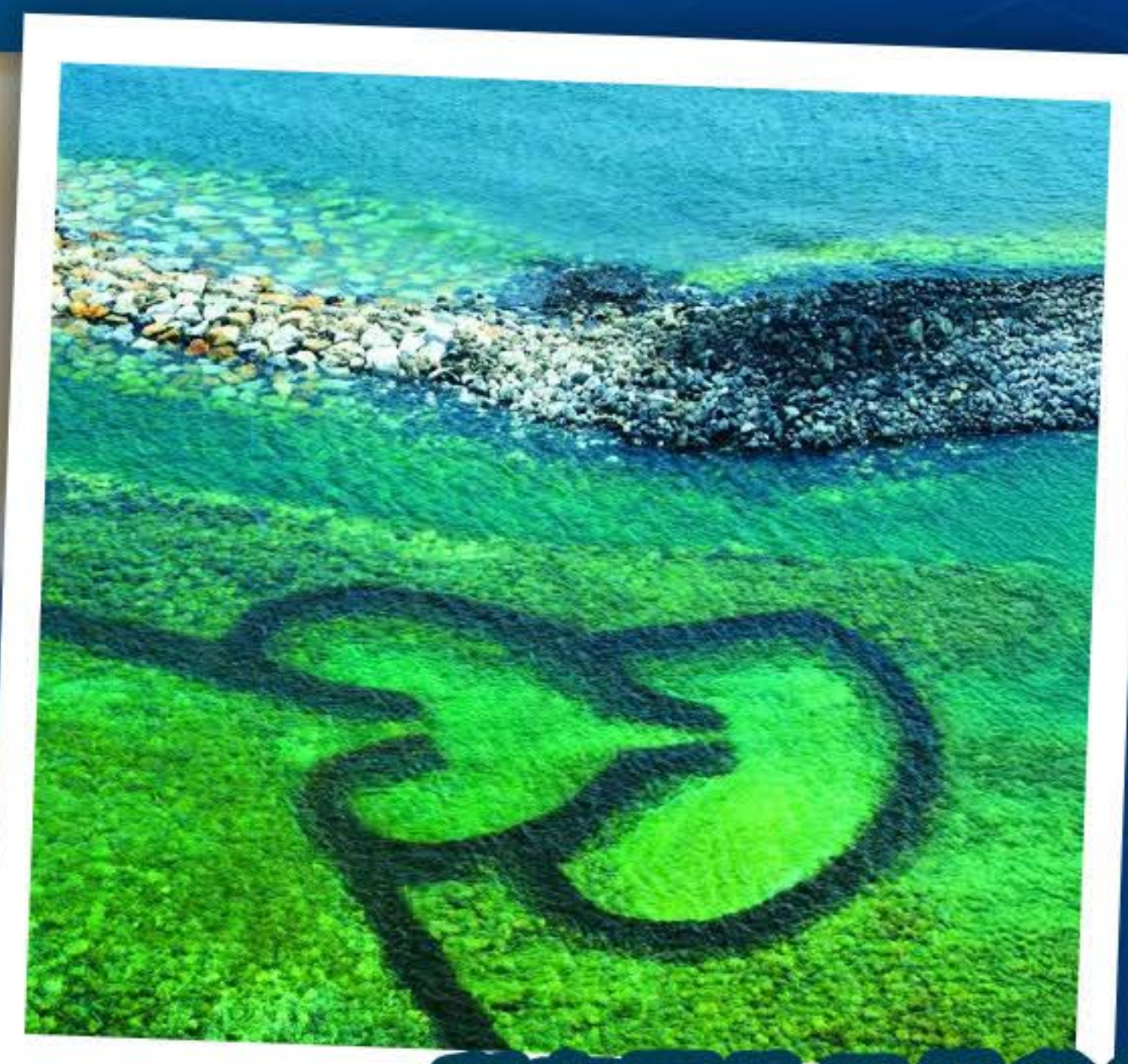
所有圖片只供參考