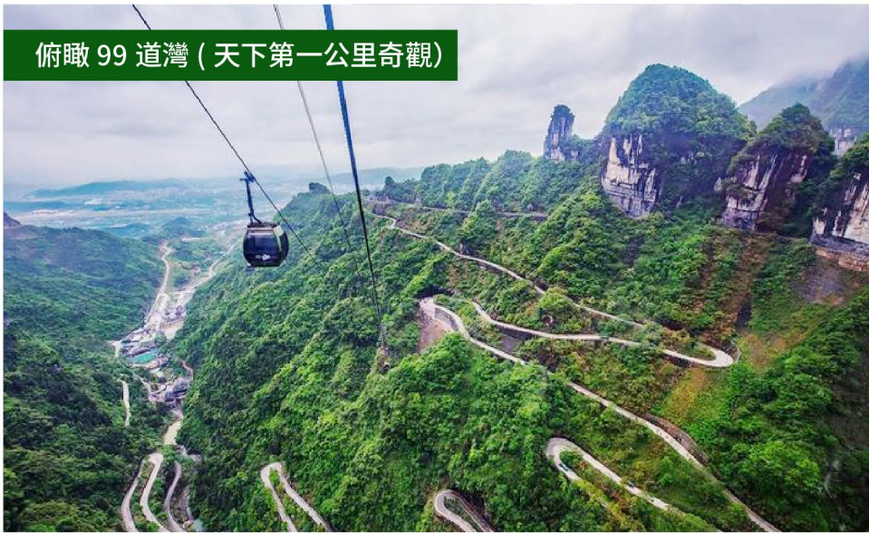
俯瞰 99 道灣 (天下第一公里奇觀)