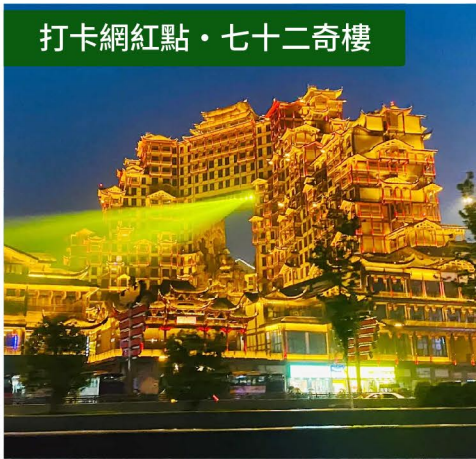
打卡網紅點·七十二奇樓